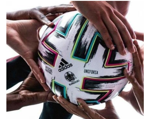
#Inclusief & #Divers